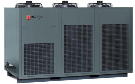
ACVE 055 (mit Option Farbe RAL 7043 - verkehrsgrau B; ACVE 090, 120 mit zwei bzw. ACVE 150 mit drei Ventilatoren)