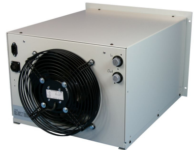
ProfiCool Exactus PCEX 020 (Rückansicht)

Weitere Optionen/Zubehör sowie Pumpenalternativen auf Anfrage.