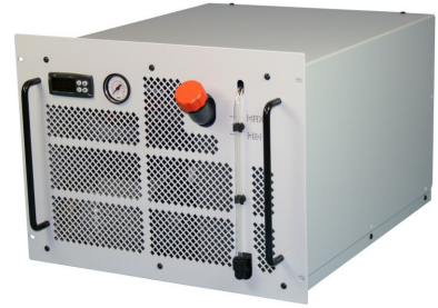
ProfiCool Exactus PCEX 020