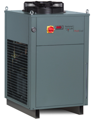
ProfiCool Genius Zero (mit Option Sonderfarbe RAL 7043, verkehrsgrau B)