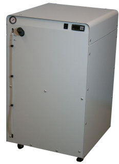
ProfiCool Primus PCPR 055 (mit Option Rollen)