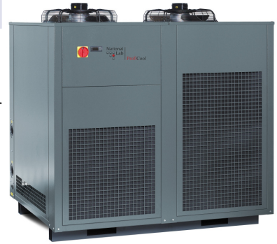
ProfiCool Genius (mit Option Sonderfarbe RAL 7043, verkehrsgrau B)